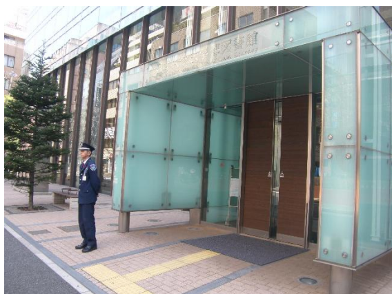
メインエントランス警備業務