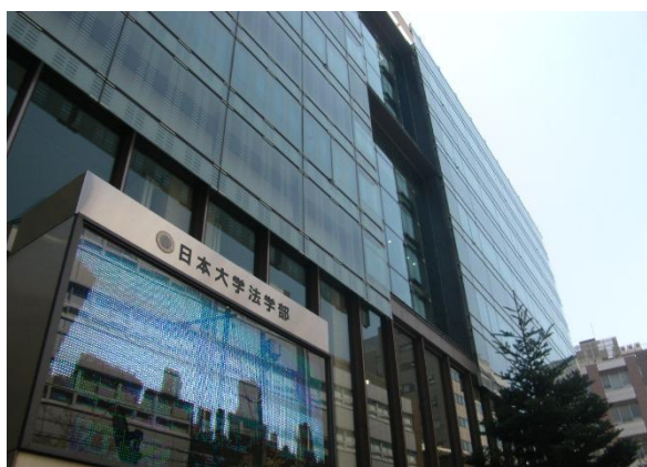
日本大学法学部図書館外観

その成果として、本年 4 月 1 日より、日本大学法学部図書館の施設警備業務を受注し、業務を開始しています。これ以降も積極的に 1 号警備業務に取り組んで参る所存です。どうぞ、ご注目ください。