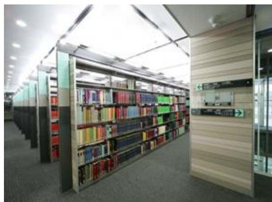
日本大学法学部図書館内観